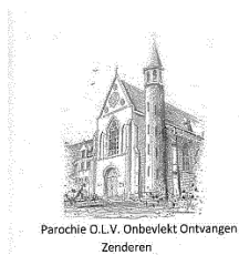
Parochie O.L.V. Onbevleekt Ontvangen Zenderen